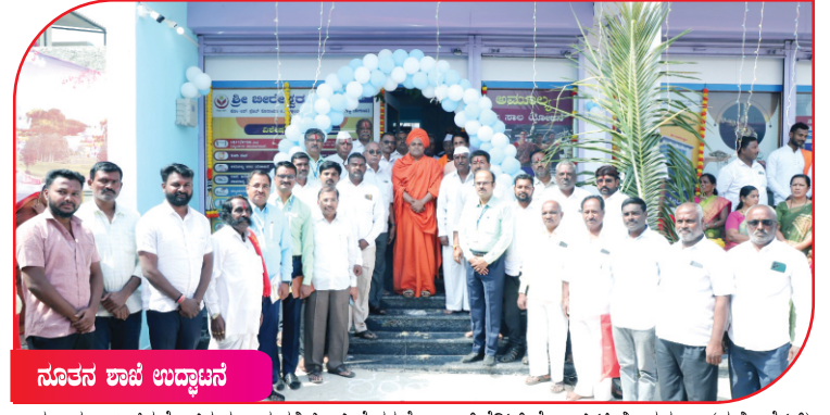
ನೂತನ ಶಾಖೆ ಉದ್ಘಾಟನೆ