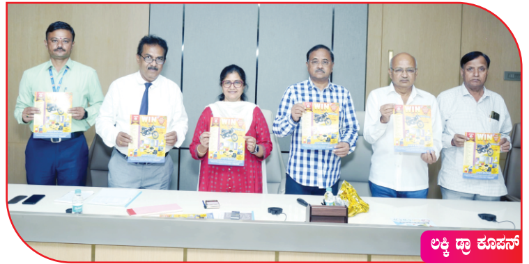
ಲಕ್ಷ್ಮಿ ಡ್ರಾ ಕೊಪನ್

ಜ್ಯೋತಿ ಬಚಾರ್ ನಲ್ಲಿ 2000/- ಮೊತ್ತದ ವಸ್ತುಗಳನ್ನು ಖರೀದಿಸಿದರೆ ಗ್ರಾಹಕರಿಗೆ ಲಕ್ಷ್ಮಿ ಡ್ರಾ ಕೊಪನ್ ನೀಡುವ ಯೋಜನೆಗೆ ಚಿಕ್ಕೋಡಿ ಲೋಕಸಭೆ ಮಾಜಿ ಸಂಸದರಾದ ಶ್ರೀ ಅಣ್ಣಾಸಾಹೇಬ ಜೊಲ್ಲೆ ಹಾಗೂ ಮಾಜಿ ಸಚಿವರ ಹಾಗೂ ನಿಷ್ಪಾಣಿ ಮತಕ್ಷೇತ್ರದ ಜನಪ್ರಿಯ ಶಾಸಕರಾದ ಸೌ. ಶಶಿಕಲಾ ಜೊಲ್ಲೆ ಅವರು ಚಾಲನೆ ನೀಡಿದ ದೃಶ್ಯ.