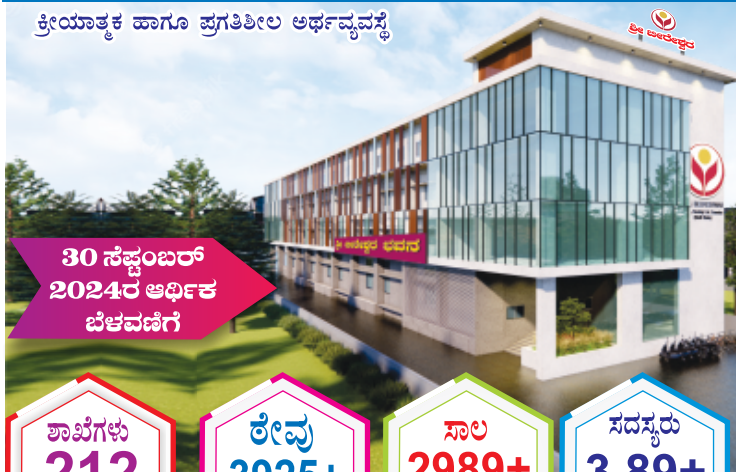
ತ್ರೀಯಾತ್ಮಕ ಹಾಗೂ ಪ್ರಗತಿಶೀಲ ಅರ್ಥವ್ಯವಸ್ಥೆ