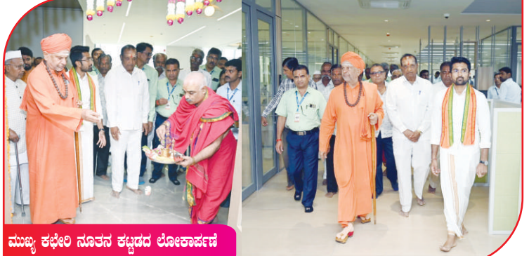
ಮುಖ್ಯ ಕಛೇರಿ ನೂತನ ಕಟ್ಟಡದ ಲೋಕಾರ್ಪಣೆ