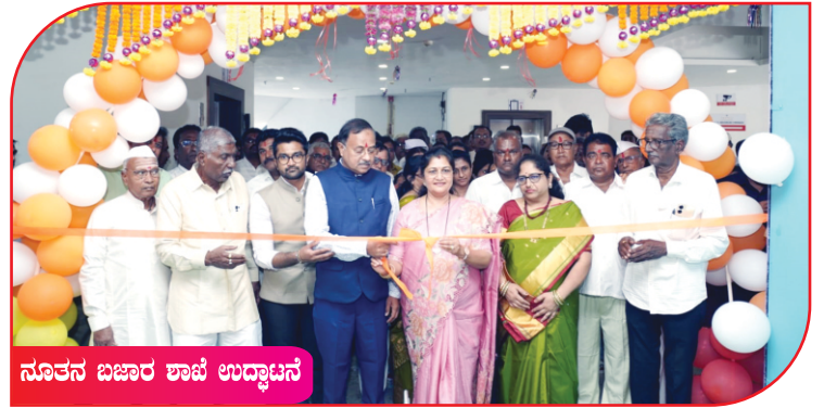
ನೂತನ ಬಜಾರ್ ಶಾಖೆ ಉದ್ಘಾಟನೆ