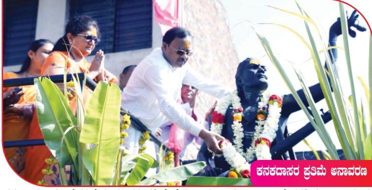
ಕನಕದಾಸರ ಪ್ರತಿಮೆ ಅನಾವರಣ