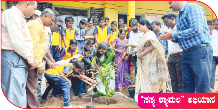
"ಸಸ್ಯ ಶ್ಯಾಮಲ" ಅಭಿಯಾನ

ನಿಷ್ಣಾಣಿ ನಗರದ ಅಕ್ಕೋಳ ಕ್ರಾಸ್ ಪಾರ್ವತಿ ಕಾರ್ನಾಡಿಂದ ಹಾಲ್ಸಿಡ್ನಾಥ ಮಂದಿರವರೆಗೆ ರಸ್ತೆಯ 2 ಬದಿಯಲ್ಲಿ ವಿವಿಧ ಪ್ರಕಾರದ ಹೂಗಳ ಸಸಿ ನೆಡುವ ಕಾರ್ಯಕ್ರಮಕ್ಕೆ ಮಾಜಿ ಸಚಿವರು ಹಾಗೂ ನಿಷ್ಣಾಣಿ ಮತಕ್ಷೇತ್ರದ ಜನಪ್ರಿಯ ಶಾಸಕರಾದ ಸೌ. ಶಶಿಕಲಾ ಜೊಲ್ಲೆ ಯವರು ಚಾಲನೆ ನೀಡಿದರು.