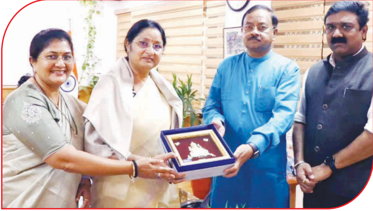
ನವದೆಹಲಿಯಲ್ಲಿ ಕೇಂದ್ರ ಶಿಕ್ಷಣ ಇಲಾಖೆಯ ರಾಜ್ಯ ಖಾತೆ ಸಚಿವರಾದ ಶ್ರೀಮತಿ ಅನ್ನಪೂರ್ಣಾದೇವಿ ಅವರನ್ನು ಮಾಜಿ ಸಚಿವರು ಹಾಗೂ ನಿರ್ವಾಣಿ ಮತಕ್ಷೇತ್ರದ ಜನಪ್ರಿಯ ಶಾಸಕರಾದ ಸೌ. ಶಶಿಕಲಾ ಜೊಲ್ಲೆ ಹಾಗೂ ಚಿಕ್ಕೋಡಿ ಲೋಕಸಭೆ ಸಂಸದರಾದ ಶ್ರೀ ಅಣ್ಣಾಸಾಹೇಬ ಜೊಲ್ಲೆ ಯವರು ಸೌಹಾರ್ದಯುತವಾಗಿ ಭೇಟಿ ಮಾಡಿದರು.