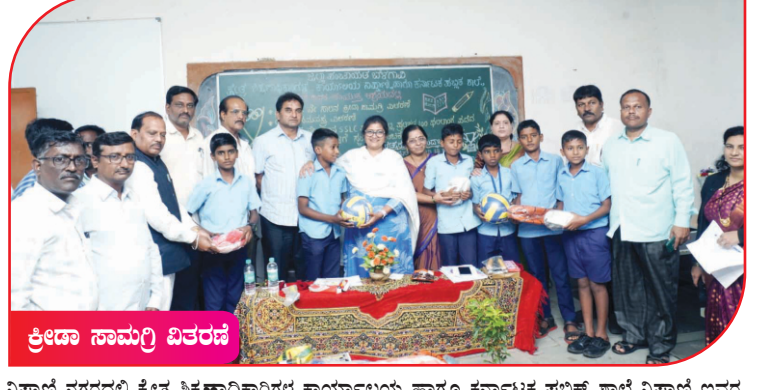
ಕ್ರೀಡಾ ಸಾಮಗ್ರಿ ವಿತರಣೆ