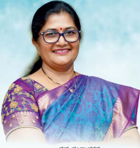
ಸಹ ಸಂಸ್ಥಾಪಕರು ಸೌ. ಶತಿಕಲಾ ಅಣ್ಣಾಸಾಹೇಬ ಜೊಲ್ಲೆ ಶಾಸಕರು, ನಿಪ್ಪಾಣಿ.