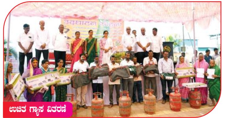
ಉಚಿತ ಗ್ಯಾಸ್ ವಿತರಣೆ

ಮೂಡಬಿದರೆಯಲ್ಲಿ ಜರುಗಿದ ಅಂತರಾಷ್ಟ್ರೀಯ ಸಾಂಸ್ಕೃತಿಕ ಜಾಂಬೂರಿಯಲ್ಲಿ ಭಾಗವಹಿಸಿದ ವಿದ್ಯಾರ್ಥಿಗಳಿಗೆ ಹಾಗೂ ರಾಜ್ಯಪಾಲರಿಂದ ಪುರಸ್ಕಾರ ಪಡೆದ ನಮ್ಮ ತಾಲೂಕಿನ ಸ್ಕೌಟ್ಸ್ & ಗೈಡ್ಸ್ ವಿದ್ಯಾರ್ಥಿಗಳು ಹಾಗೂ ಶಿಕ್ಷಕರ ಅಭಿನಂದನಾ ಸಮಾರಂಭಕ್ಕೆ ಕರ್ನಾಟಕ ರಾಜ್ಯ ಸಚಿವರಾದ ಸೌ. ಶಶಿಕಲಾ ಜೊಲ್ಲೆ ಚಾಲನೆ ನೀಡುತ್ತಿರುವುದು.