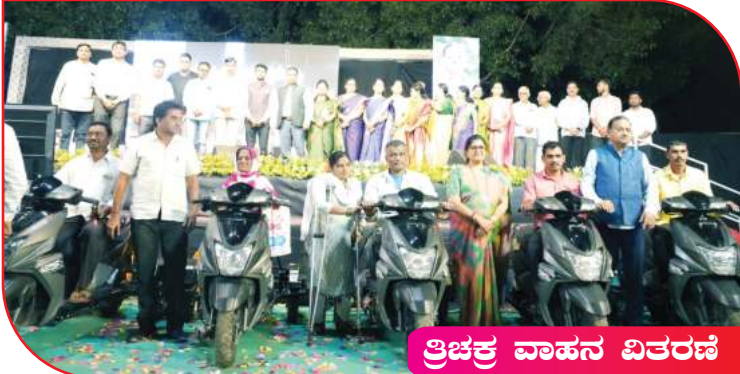
ತ್ರಿಚಕ್ರ ವಾಹನ ವಿತರಣೆ