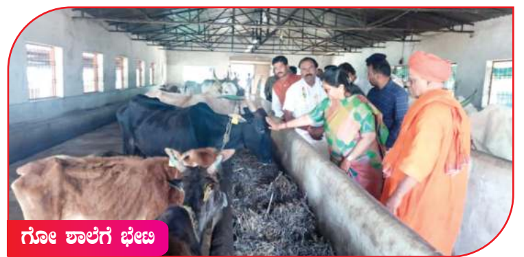
ಗೋ ಶಾಲೆಗೆ ಭೇಟಿ