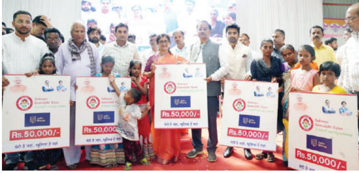
ನಿಷ್ಪಾಣಿಯಲ್ಲಿ ಚಿಕ್ಕೋಡಿ ಸಂಸದರಾದ ಶ್ರೀ ಅಣ್ಣಾಸಾಹೇಬ ಜೊಲ್ಲೆ ಅವರ ಜನ್ಮದಿನದ ಪ್ರಯುಕ್ತ 10 ಜನ ಅನಾಥ ಹೆಣ್ಣು ಮಕ್ಕಳಿಗೆ ಸುಕನ್ಯಾ ಸಮೃದ್ಧಿ ಪಾಸ್ ಬುಕ್‌ಗಳನ್ನು ವಿತರಿಸುತ್ತಿರುವುದು.