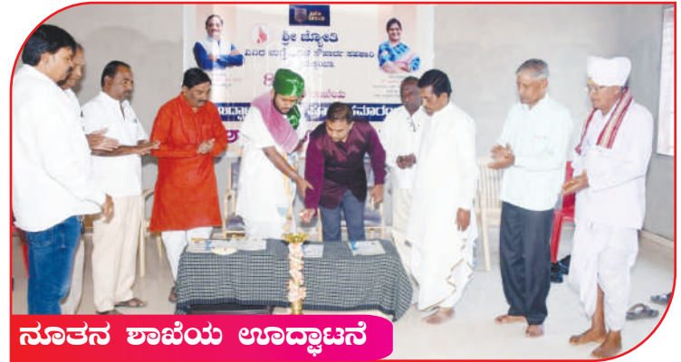
ನೂತನ ಶಾಖೆಯ ಉದ್ಘಾಟನೆ