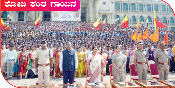
ಕೋಟ ಕಂಠ ಗಾಯನ