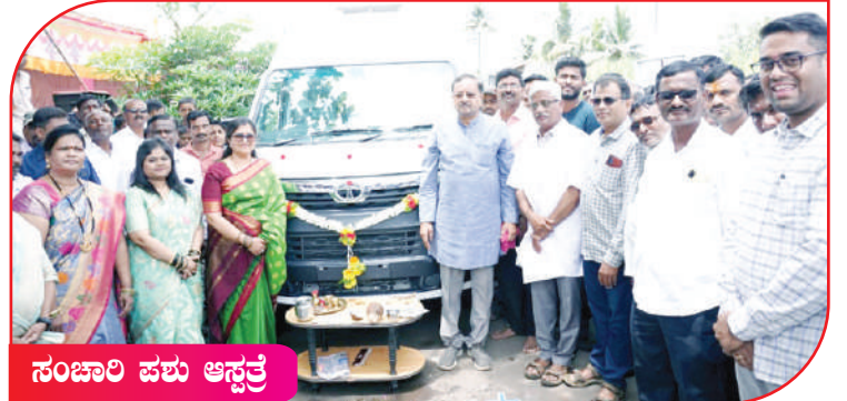
ಸಂಚಾರಿ ಪಶು ಆಸ್ಪತ್ರೆ