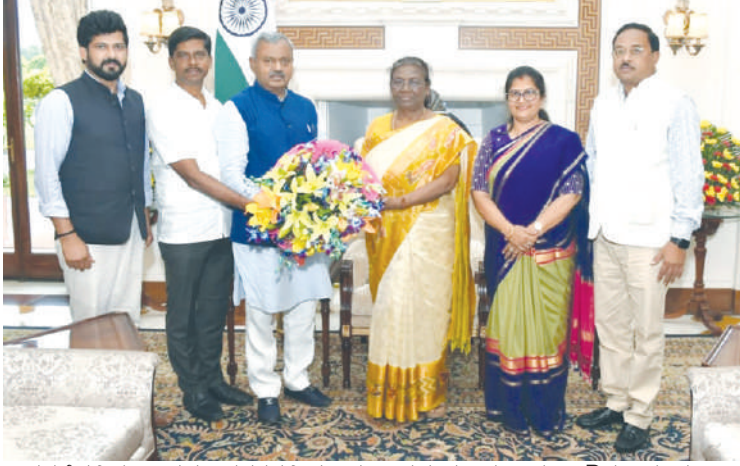
ನವದೆಹಲಿಯ ರಾಷ್ಟ್ರಪತಿ ಭವನದಲ್ಲಿ ಸನ್ಮಾನ್ಯ ರಾಷ್ಟ್ರಪತಿಗಳಾದ ಶ್ರೀಮತಿ ದ್ರೌಪದಿ ಮುರ್ಮು ಅವರನ್ನು ಭೇಟಿ ಮಾಡಿ, ವಿಶ್ವವಿಖ್ಯಾತ ನಾಡಹಬ್ಬ ಮೈಸೂರು ದಸರಾ ಮಹೋತ್ಸವ-2022ರ ಉದ್ಘಾಟನಾ ಕಾರ್ಯಕ್ರಮಕ್ಕೆ ಆಹ್ವಾನ ನೀಡುತ್ತಿರುವ ದೃಶ್ಯ.

ಶ್ರೀ ಜೀವೇಶ್ವರ ಕೋ-ಆಪ್. ಕ್ರೆಡಿಟ್ ಸೊಸಾಯಟಿ ಅ., ಯಕ್ಷಂಜಾ (ಮಲ್ಲ-ಸ್ಥಳ)