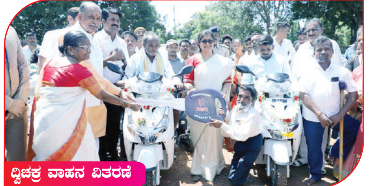
ದ್ವಿಚಕ್ರ ವಾಹನ ವಿತರಣೆ