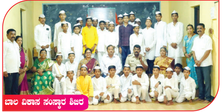
ಬಾಲ ವಿಕಾಸ ಸಂಸ್ಥಾರ ಶಿಬಿರ